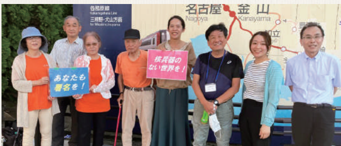
名鉄岐阜駅前での街頭署名の様子

全岐阜県生協連が会員として参加する「被爆者の願いを継承する岐阜県民の会」では、核兵器の廃絶を目指し2021年から署名活動に取り組んでいます。今年11月までの累計署名数は65,375筆となりました。毎月の街頭署名も25回行い950筆の署名を集めました。集まった署名用紙は年次で日本被団協に送付しています。今年は日本被団協がノーベル平和賞受賞という嬉しいニュースがあった一方で、世界の各地で戦争や武力衝突が続き核兵器の使用リスクも高まっています。来年はヒロシマ・ナガサキ80周年の節目の年であり、引き続き被爆者の皆さんとともに行動していきます。