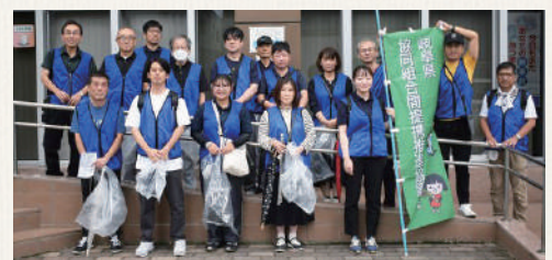
JAひだ高山支店にて集合写真

全岐阜県生協連が加盟する岐阜県協同組合間提携推進協議会の取り組みとして2018年から地域の清掃活動に取り組んでいます。今年度は、2回の活動を実施しました。8/11(日)の「ぎふ長良川花火大会清掃活動」には、県内の企業や団体、個人のボランティアなどが参加し、前日の花火大会翌朝の長良川河畔を清掃しました。協議会からは18名が参加しました。9/21(土)の「古い町並み及び宮川朝市周辺の清掃活動」は、外国人観光客で賑わう高山市の観光地域を8団体18名が参加して清掃しました。ふるさとの自然や町並みの様子に触れながら清掃活動をするのはとても気持ちがよく、地域の方から声をかけいただくのも励みになっています。