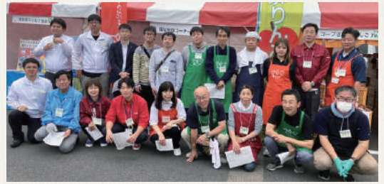
朝礼での集合写真

2024年10月26日(土)・27日(日)、岐阜県庁周辺で「第35回岐阜県農業フェスティバル」が開催され、今年も会員生協、関連団体の方で「生協コーナー」を出展しました。岐阜県産品を使った「生協のやきそば」「七色串(やきとり)」「飛騨のりんご」の販売の他、「福祉施設コーナー」「ユニセフコーナー」「輪投げ」など、延べ74名がスタッフ参加し、来場者に元気にアピールして、ほぼ終日多くの来場者で賑わいました。この生協コーナーも長年出展してきたことで着実に定着してきており、毎年楽しみに買いに来ていただけるようになりました。売上げの中から今年もユニセフに募金をお贈りしました。約21万人が来場する県内最大級のイベントですので、これからも協力しあい楽しく出展していきたいと思っております。